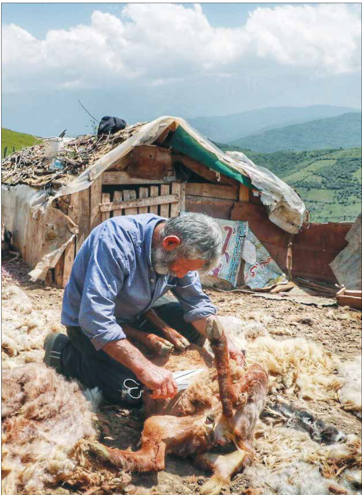
ورینا؛ پشم چینی گوسفندان در مازندران