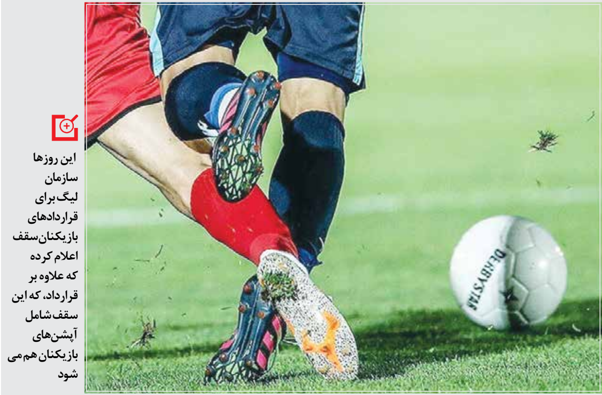
سازمان لیگ فوتبال ایران به دنبال سخت‌گیری در قراردادهای بازیکنان است و می‌خواهد نظارت بیشتری روی آنها داشته باشد.

جای بخشی از پول، به بازیکنان اتمویل بدهند؛ اتمویل‌هایی که پلاک نداشت و در پارکینگ منزل بازیکنان سال‌ها خاک خورد و درنهایت بعد از چند سال با شرایط خاصی موفق شدند آنها را به فروش برسانند.