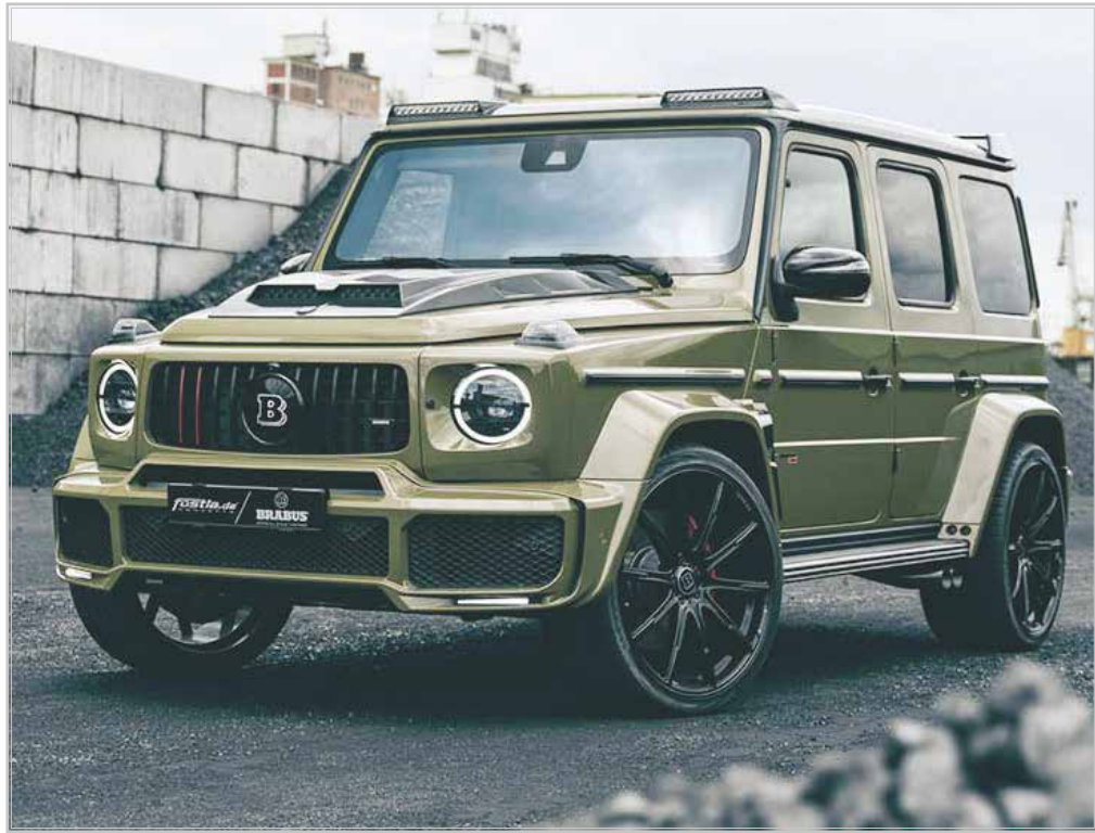
مرسدس بنز G کلاس یکی از محبوب‌ترین شاسی بلندها بین تیونرها بوده و نسخه AMG G63 آن نیز گل سرسبد این خانواده محسوب می‌شود. کمپانی‌های زیادی وجود دارند که نسخه‌های ارتقا یافته از G63