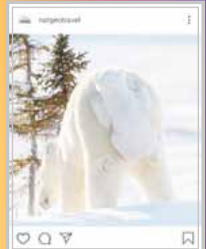
نشانی جئوگرافیک: سواری گرفتن توله خرس قطبی از مادرش