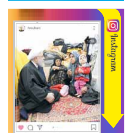
رئیس جمهوری: مردم مناطق سیل‌زده بدانند که دولت در کنارشان ایستاده