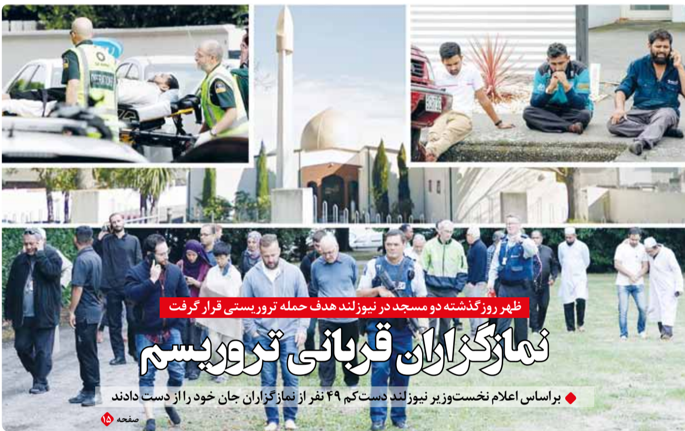
ظهر روز گذشته دو مسجد در نیوزلند هدف حمله تروریستی قرار گرفت

گروه سیاسی - محور اصلی خطبه‌های نماز جمعه این هفته موضوع گرانی‌ها و وضعیت معیشتی مردم بود. در واقع ائمه جمعه روی خطاب‌شان را به مسئولان به ویژه دولت قرار داده بودند و از آنها می‌خواستند تا برای بهبود شرایط فکر و تدبیری بیندیشند. ائمه جمعه تا پیش از این هرگاه به موضوع لوائح چهارگانه به ویژه پالرمو و Cft می‌رسیدند محال بود صحبتی از خیانت به کشور و متهم کردن حامیان آن مطرح نشود، اما دیروز باتوجه به دیدار