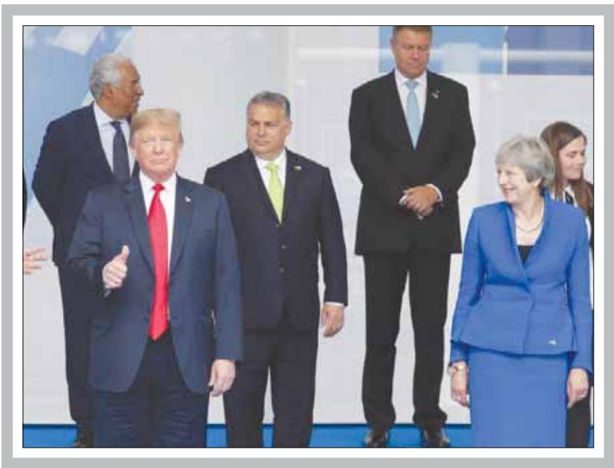
محمد رضا ستاری