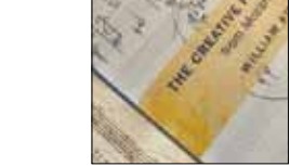
چوب حراج به دست‌نوشته‌های «موتزارت» و «ون‌گوگ»

دست‌نوشته‌ای از آهنگ ساخته شده توسط «موتزارت» و نامه‌ای از «ونسان ون‌گوگ» از جمله آثاری است که در حراجی آثار موسیقیدانان، هنرمندان و نویسندگان در پاریس به حراج گذاشته می‌شود. به گزارش ایسنا به نقل از رویترز، کمیانی فرانسوی آریستوفیل در سال ۱۹۹۰ تأسیس شد و با جمع آوری سرمایه اقدام به خرید ۱۳۰ هزار اثر هنری و یادگار به جا مانده از هنرمندان سرشناس کرد و قرار بود سود حاصل از فروش این موارد را با سرمایه‌گذاران سهیم شود، اما حالا پس از اعلام ورشکستگی در تلاش است همه این آثار را به فروش برساند. جدیدترین حراجی برای فروش این آثار هفته جاری برگزار می‌شود و دست‌نوشته یکی از آهنگ‌های «موتزارت» بین ۱۴۱ تا ۱۷۷ هزار دلار قیمت‌گذاری شده است. نامه‌ای از «ونسان ون‌گوگ» نقاش مشهور به دوستش که با طراحی‌های از خود وی همراه است نیز از دیگر آثار برچسته در این حراجی است که قیمت تخمینی آن بین ۲۹۴ تا ۳۵۲ هزار دلار اعلام شده است.