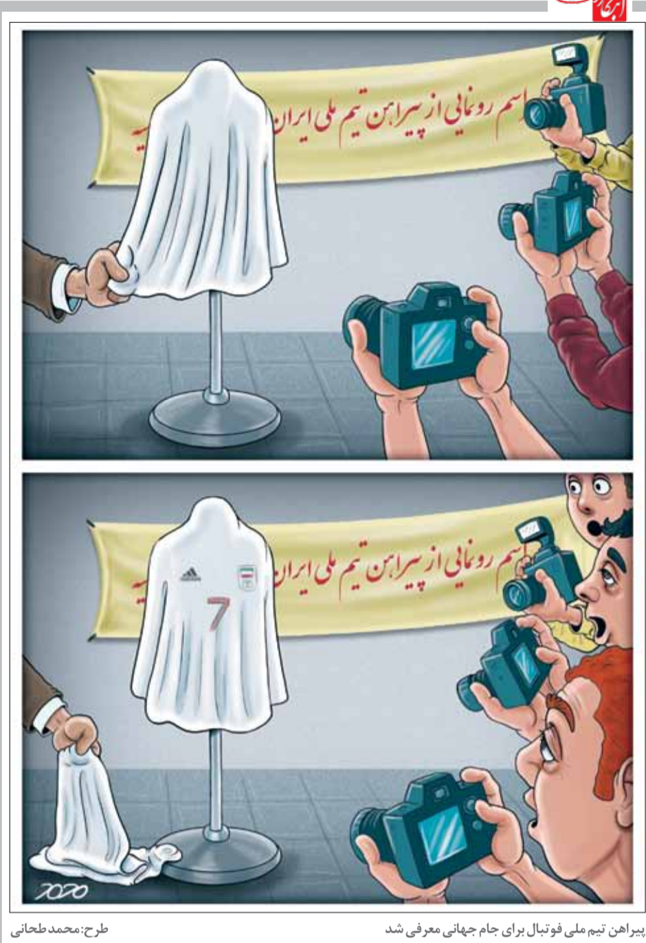
پیراهن تیم ملی فوتبال برای جام جهانی معرفی شد طرح: محمد طحانی