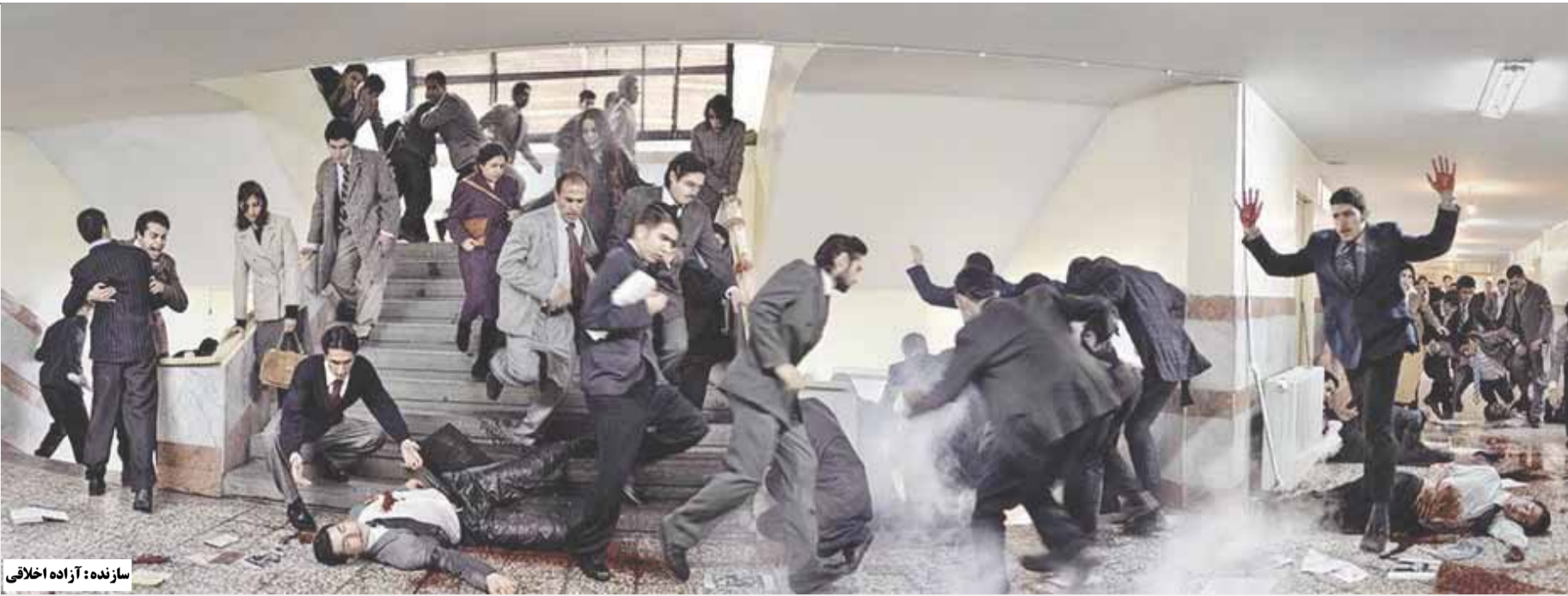
سازنده: آزاده اخلاقی